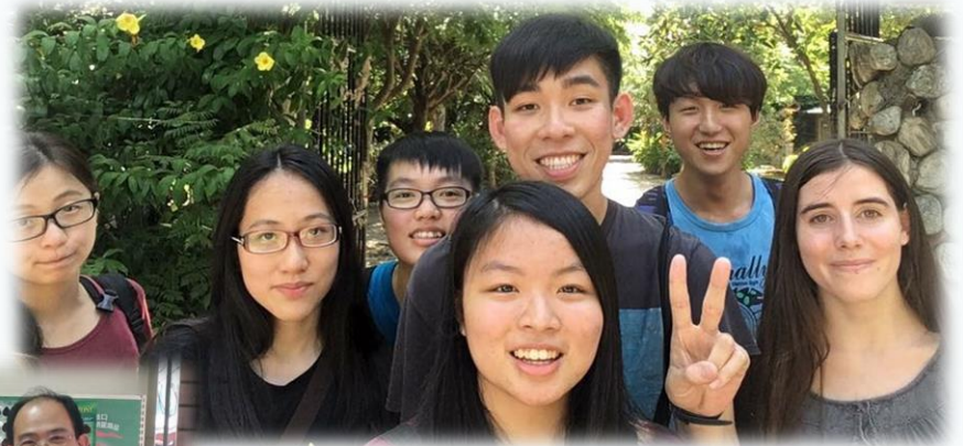
▲ 接待學生與國際交換生之合影

很感謝有這次的機會能與外國學生有這麼長的交流時間，這樣的學習比去英文補習班要真實的多，也很開心認識了這群新朋友。