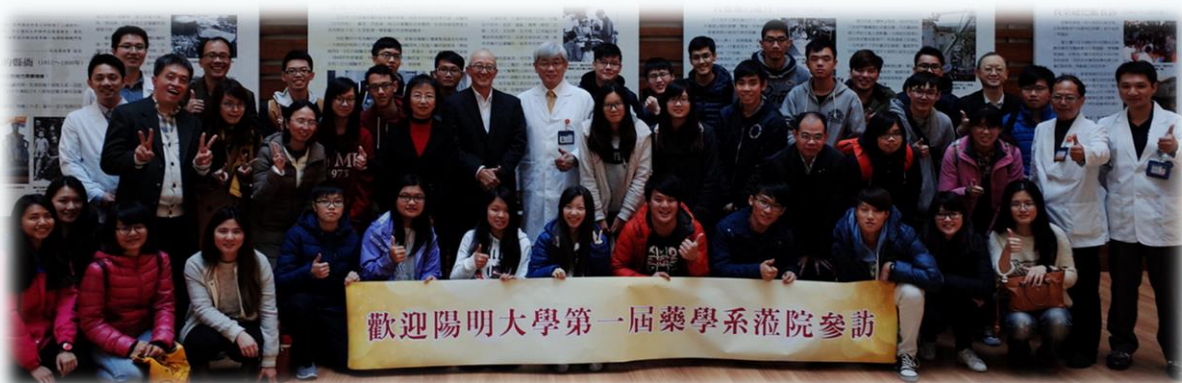
▲ 全體師生與國立陽明大學附設醫院院長(中)及藥劑部同仁合影