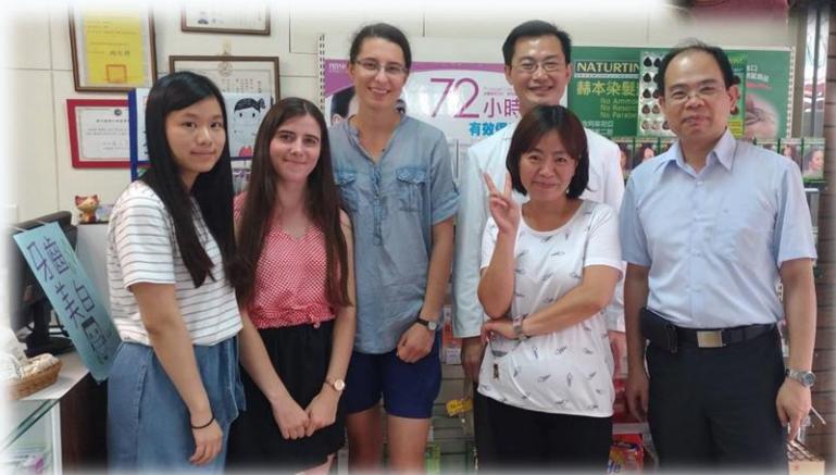
◀ 國際交換生參訪社區藥局