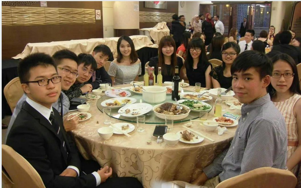
▲ 晚餐時間與新結識的朋友們相談甚歡