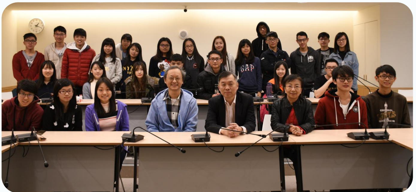
▲ 師長、同學們與講者合影

最後教授和我們說些勉勵的話，鼓勵我們不要把自己看得太輕，態度決定高度，自然不要過於驕傲，但是也不要妄自菲薄。此外，要在成長過程中去了解、認識自己，知道自己適合或是不適合做甚麼，再來規劃未來的人生，像教授就很明白知道自己不適合實驗室做研究的生活，因此也沒有選擇出國。我想人生態度的部分真的直得好好思考，才不會在人生大陸上常常感到茫然，找不到奮鬥的目標與意志。