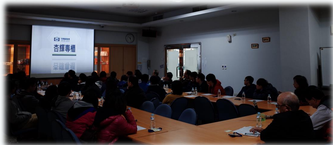
▲ 聆聽杏輝藥廠之簡介