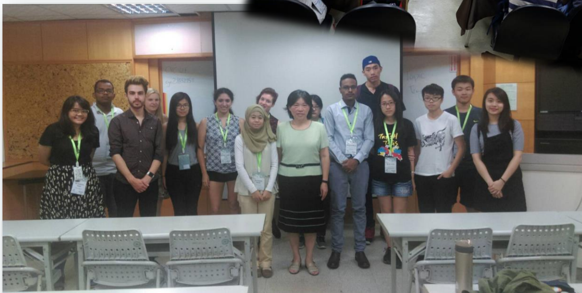
▲ 課程結束後與講師之合影