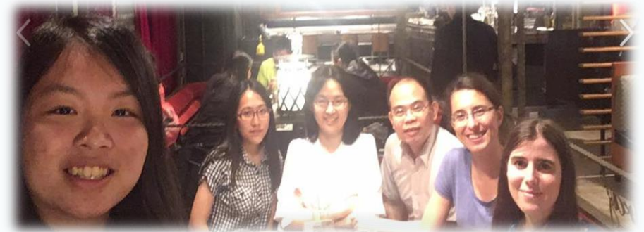
▲ 接待學生與國際交換生一同聚餐

2017年的這個暑假，透過藥學生聯合會的學生交換計畫(SEP)，我們接待了來自法國、加拿大、斯洛伐克等三國的交換生。平時的上班時間裡，他們在和信醫院進行實習，而到了下班時間，就輪到我們帶他們遊玩台北、認識台灣。短短一個月的交流時間，我們從互不相識、語言不通的幾個人，漸漸成了能夠暢所欲言、彼此交流的一群朋友。