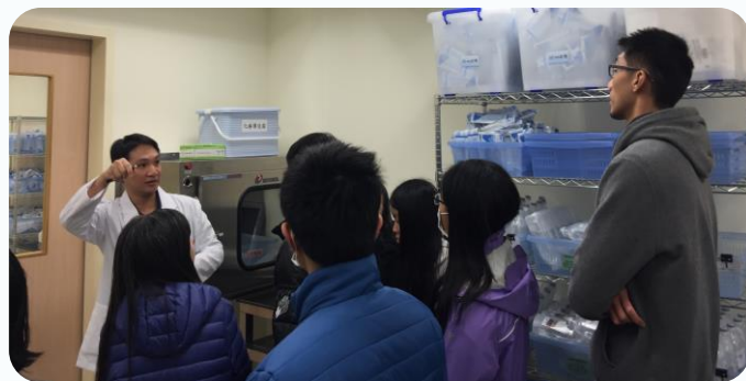
▲ 大家聆聽藥師的解說

而同一天，我們參訪了杏輝藥廠的宜蘭總廠，令我印象深刻的是，廠裡有一座螃蟹公園，而且在癌症製劑中心的門口，地面也畫了螃蟹圖騰，所以員工進入廠房前都會「踩螃蟹一下」。還沒想透螃蟹代表什麼意義的我，更加仔細的聽導覽人員娓娓道來。因為俗稱癌症的惡性腫瘤，表面通常有個堅實的中心，接著向外伸出分支，形狀就像隻螃蟹一樣。這就是古希臘用「Cancer」來命名癌症的由來。杏輝的企業文化正是藉由踩螃蟹，來提醒自己要努力製藥，克服癌症。成功的把抗癌的精神具像化，在日常生活中，時時警惕自己。在人生的道路上，我們常在追逐的過程中迷失，莫忘初衷寫起來很容易，要做到卻很難，看著杏輝藥廠處處提醒自己莫忘抗癌精神，讓我不禁也想起自己當初選擇藥學系的初衷，我的夢想是照顧好自己並且能夠幫助別人，所以這樣的初衷支持著我用功唸書，將來才能運用專業知識去幫助有需要的人。