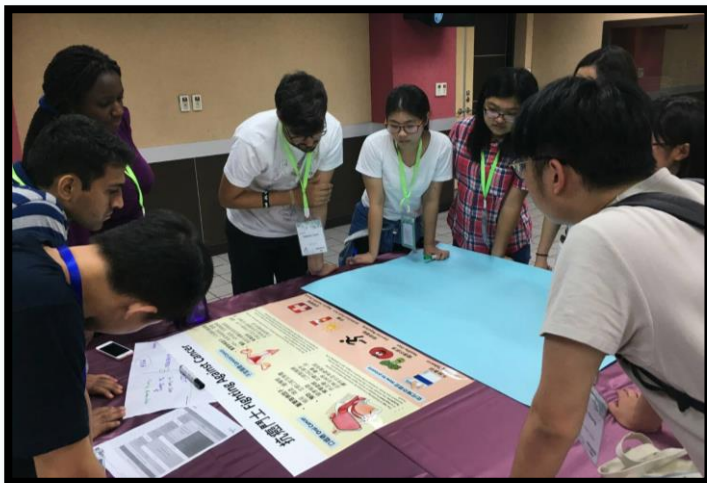
▲ 大家正在準備衛教活動

總而言之，這次的藥學生年會，真的讓我交到了很多朋友，國內的、國外的、新加坡的、馬來西亞的、香港的甚至是非洲的，雖然我可能這輩子都不會再見到他們，但和他們這十天的相處，其中的快樂，其中的歡愉，深深烙印在我腦海裡，就像江南Style、就像Apple pen，想忘也忘不掉，縱使我可能不會再見到他們，縱使他們在我的生命中只是個過客，但好歹他們也是外國來的。