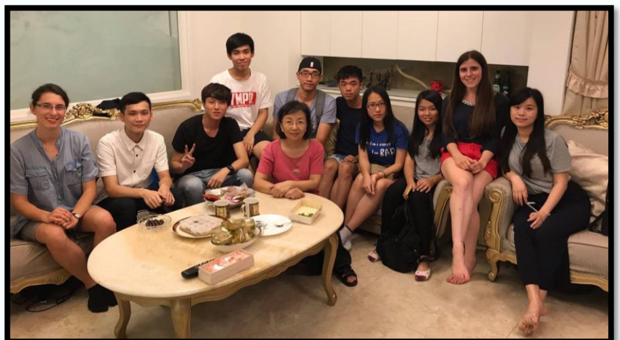
▲ 接待學生與國際交換生一同至系主任家聚餐

這樣的接待活動，無非就是希望透過來自不同地方的學生間彼此交流，能夠拓寬我們的視野，了解不同國家跟我們不一樣的地方，也更加理解台灣的獨特性。經過這次的接待活動，除了多認識了很多不同國家的朋友，其實在介紹給他們台灣的同時，也讓我再一次的認識了台灣的美。