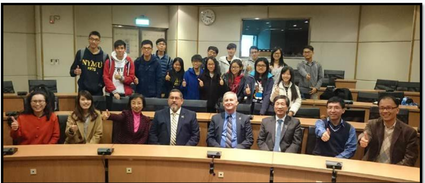
▲ Taking a photo with the foreign guests