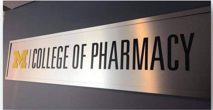
▲ College of Pharmacy, University of Michigan

I have to say that I was really into the first talk introducing University of Michigan. I'd heard from my dad that the educational system in US is quite different from Taiwan's, so the speech gave me a significant opportunity to get a closer look at this. With so many faculties in MU, students here would get more chance to interact with each other, leading to creating a wonderful environment for learning.